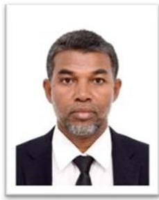
ئورمانىيە ئورمانىيە تاجىكستان ئۆلكىسى ۋە يېقىن ئەتراپتىكى دۆلەتلەردىكى تاجىك تىبابەتچىلىك ئىنستىتۇتىنىڭ باشلىقى